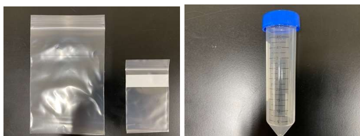
ビニール袋（中・小）